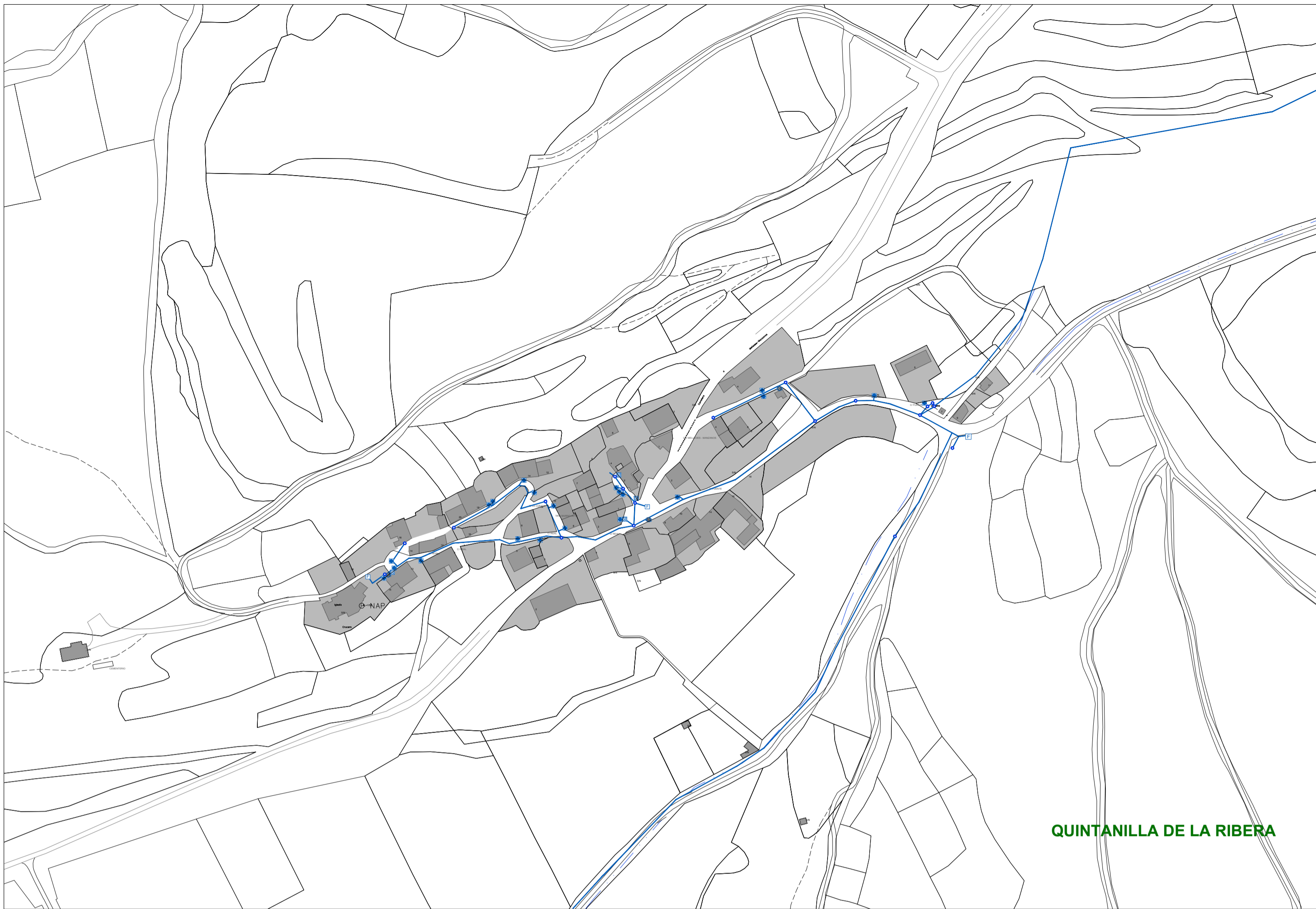
QUINTANILLA DE LA RIBERA